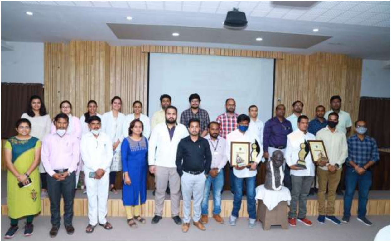
Glimpses of MGMIOP Ability Award 2020