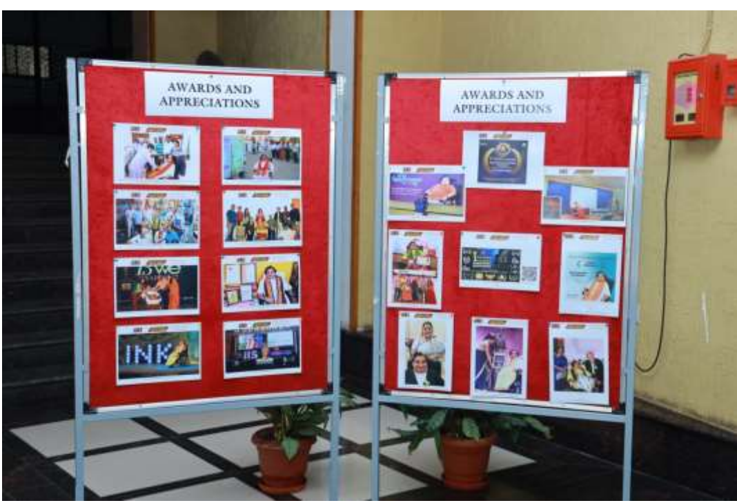
Visual display of the life of the award recipient