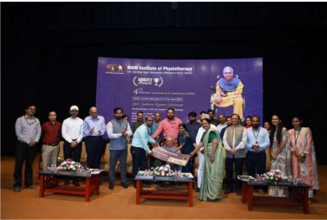
MGMIOP Ability Award 2023