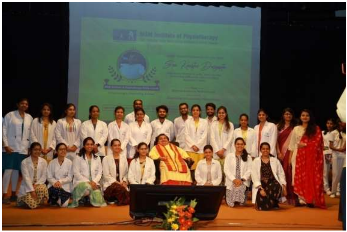
MGMIOP Ability Award 2021